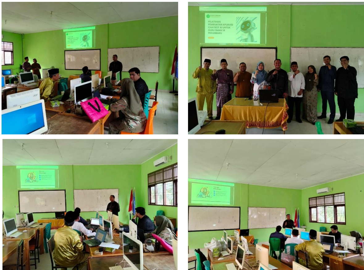
Gambar 2. Proses Pelatihan

Peserta langsung melakukan praktik pembuatan chatbot dengan dipandu oleh tim pengabdian. Langkah-langkah yang dilakukan meliputi pembuatan akun, perancangan alur percakapan, hingga uji coba chatbot. Seluruh peserta aktif mencoba setiap fitur, bertanya, dan berdiskusi. Pada akhir sesi praktik, seluruh guru berhasil membuat prototipe chatbot sederhana yang dapat menjawab pertanyaan dasar terkait jadwal pelajaran maupun informasi umum sekolah.