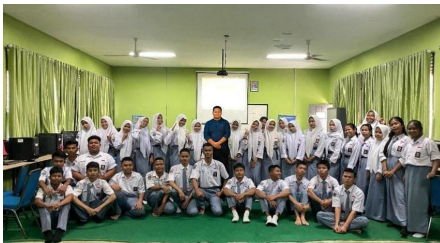
Gambar 3. Foto Bersama Selesai Kegiatan Pengabdian

Dari hasil kuesioner, terlihat perubahan signifikan dalam beberapa aspek kompetensi siswa SMK 5 Pekanbaru, seperti pemahaman implementasi Claude AI, kemampuan menggunakan Blackbox AI, peningkatan keterampilan teknis pembuatan website, serta motivasi peserta untuk mendalami teknologi kecerdasan buatan. Grafik ini membandingkan persentase capaian peserta sebelum dan sesudah pelatihan, memberikan gambaran jelas mengenai efektivitas kegiatan dalam meningkatkan kesiapan digital siswa