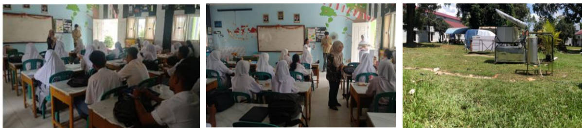
Gambar 2. Gambar 1 Diagram P-h

Tahapan kedua adalah pelaksanaan kegiatan sosialisasi yang bekerja sama dengan pihak sekolah dalam penyediaan sarana dan prasarana, seperti ruang pertemuan dan proyektor. Kegiatan sosialisasi ini mencakup penjelasan mengenai pengenalan komponen-komponen alat pemanas air tenaga matahari yang telah dikembangkan. Siswa diberikan penjelasan terkait prinsip kerja dan komponen dari alat pemanas air tenaga matahari, serta modul-modul terkait yang telah disusun untuk mendukung pembelajaran. Setelah sosialisasi selesai, akan dilakukan survei lanjutan untuk mengukur pemahaman siswa tentang prinsip kerja dan komponen pemanas air tenaga matahari skala kecil. Survei ini akan menggunakan kuisisioner yang sama dengan kuisisioner pre-test, serta diskusi untuk menggali pemahaman siswa setelah mengikuti kegiatan. Perbandingan antara hasil survei sebelum dan sesudah kegiatan akan digunakan untuk mengevaluasi tingkat keberhasilan kegiatan.